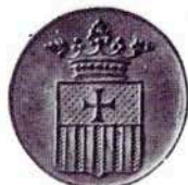
417 S. MIQUEL