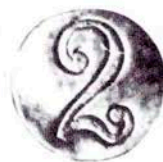
383 S. FRANCESC