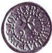
401 S. JOSEP